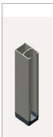
Standard sidokanal 27 x 20 mm