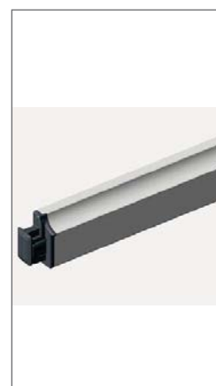
Underlist 20 x 38 mm