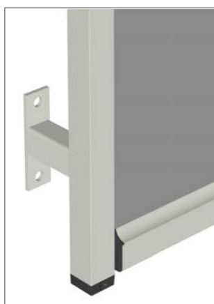
Distansbeslag 22-100 mm